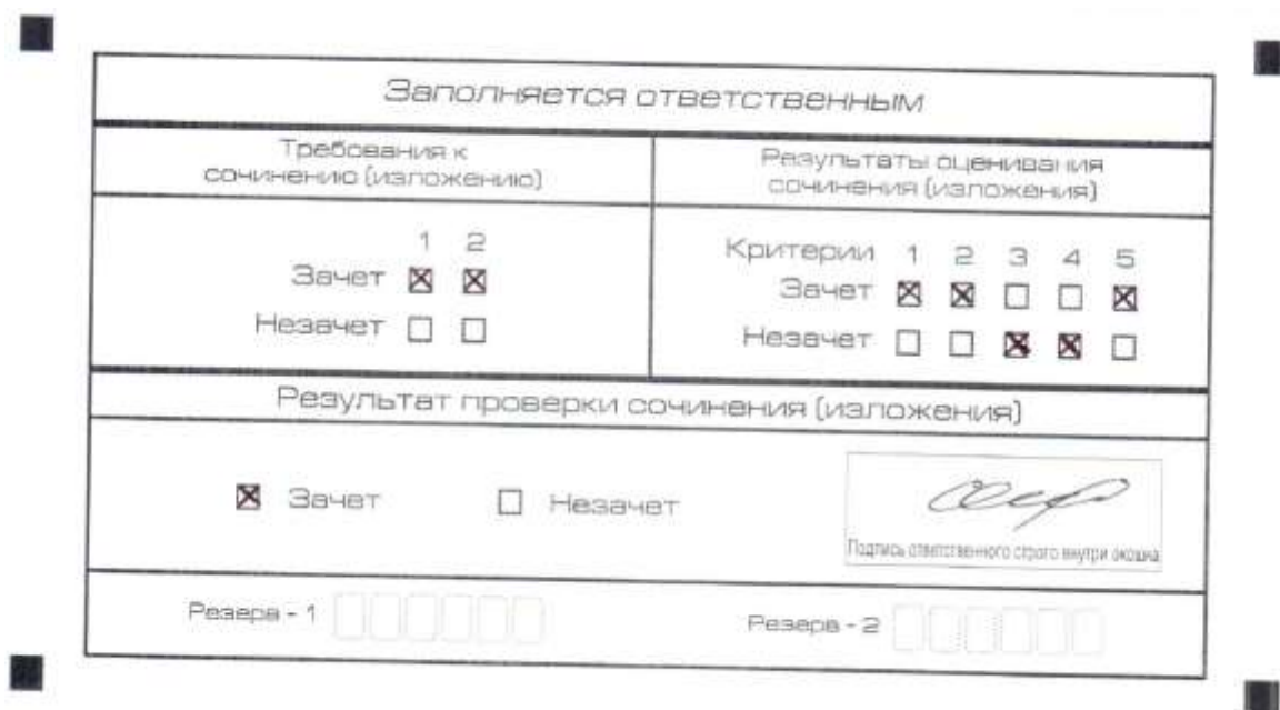
Рис. 8. Область для оценки работы

3. Во всех остальных случаях сочинение (изложение) проверяется по всем пяти критериям и оценивается по системе «зачет»/«незачет» (например, нельзя не проверять работу по критериям К4 и К5, если выпускник получил зачет на основании зачетов по критериям К1, К2, К3).